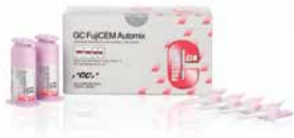
GC FujiCEM Automix