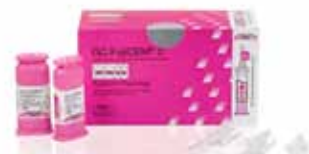
GC FujiCEM 2 SL Automix