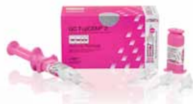
GC FujiCEM 2 Automix