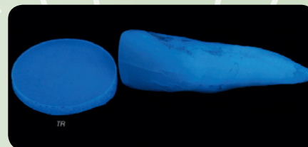
Fluorescencia cementu RelyX™ Ultimate Clicker™.

Cement RelyX Ultimate využíva modernú technológiu iniciovania tuhnutia, ktorá neobsahuje aromatické amínové zložky narušujúce dlhodobú farebnú stabilitu. V porovnaní s inými obdobnými materiálmi vykazuje RelyX Ultimate najnižšiu mieru diskolorácie pri teste ponorenia do kávy. Na dosiahnutie účinnej imitácie farebných vlastností prirodzených zubov sa do cementu pridáva špeciálna prísada, vďaka ktorej usadené náhrady vytvárajú autentickú fluorescenciu.