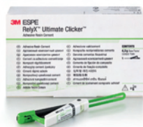
RelyX™ Ultimate Clicker™ doplňující balení – Translucent (obj. č. 56920)