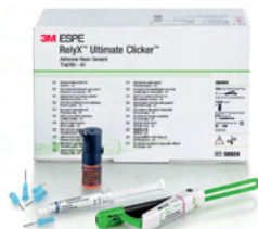
RelyX™ Ultimate Clicker™ testovací balení – A1 (obj. č. 56924)